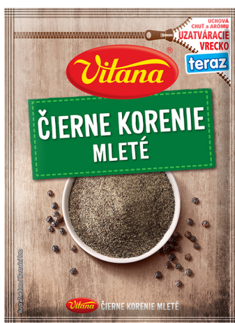
Čierne mleté korenie